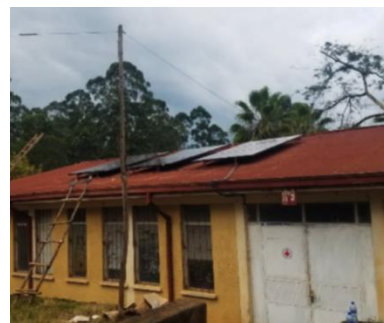
Installation einer PV Anlage am Bonga College im Rahmen des Projektes

Die bbw-Gruppe führt mit ihren Tochterunternehmen weltweit Entwicklungsprojekte im Bereich Organisationsentwicklung und Berufsausbildung durch.